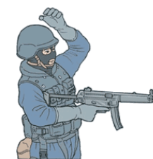
Couverture (taper le casque)