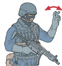
En deux colonnes