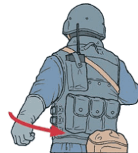
En « V »