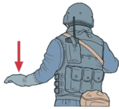
Se baisser/A couvert